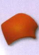
7. Elosztó kúpcserép