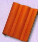
9. Félnyeregterítő szegélycserép bal