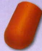
5. Kezdő kúpcserép