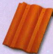
8. Félnyeregterítő cserép