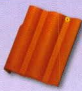
3. Szegélycserép bal