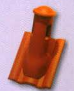
10. Szellőzőtorony cseréppel

A feltüntetett árak bruttó, Áfa-s összegek, 100 m 2 felett építési helyre szállítva. A kiadványban látható színek nyomdatechnikai okok miatt a valóságtól eltérhetnek.