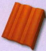
9. Félnyeregterítő szegélycserép jobb