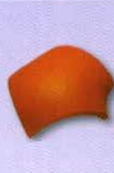
4. Elosztó kúpcserép