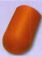
3. Kezdő kúpcserép