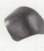
hármaskétszárú elosztó kúpcserep